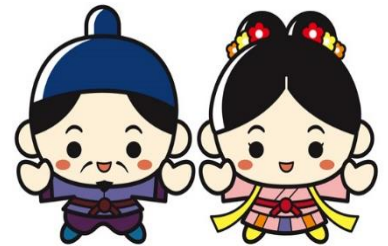
江津市PRキャラクター 「人麻呂くんとよさみ姫」

新型コロナウイルス感染症拡大により影響を受けている市内飲食店を応援していただくとともに、この機会に、ご家族やグループで地元の食を楽しむことで、江津(桜江)の良さを改めて感じていただくことを目的にプレミアム付飲食券を発行します。